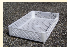
Cajas rejadas sin altos